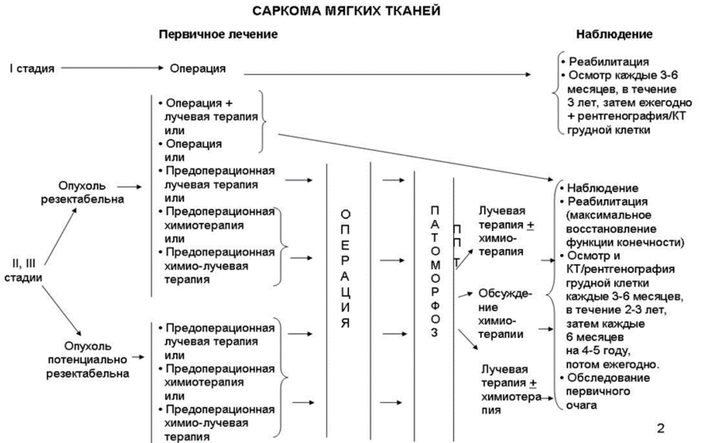
Схема 1. Блок-схема диагностики и лечения пациентов с саркомами мягких тканей