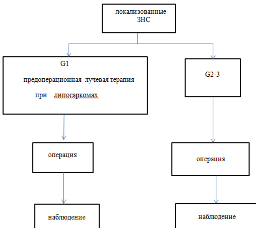
Рис.1. Схема лечения пациентов локализованными забрюшинными неорганными саркомами.